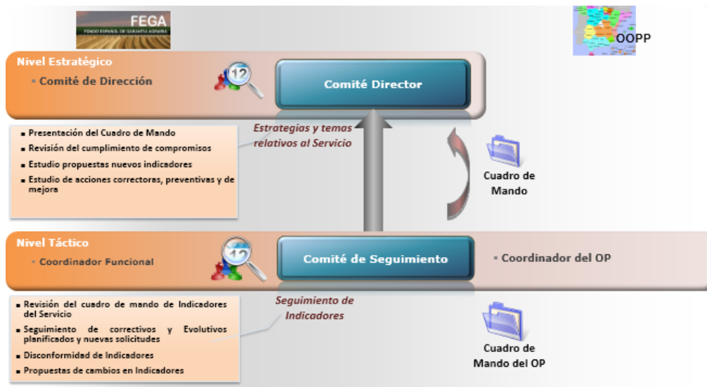
Ilustración 3. Modelo de control y seguimiento de indicadores

Al final de cada año natural, se realiza un informe resumen o balance de los indicadores en función de los cuales se podrán tomar las decisiones que se acuerden.