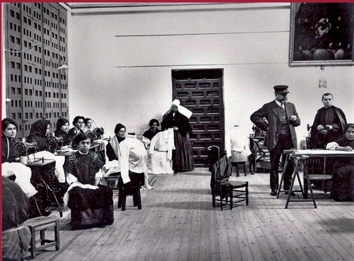
La cárcel de mujeres de la calle de Quiñones de Madrid, a finales del siglo XIX.