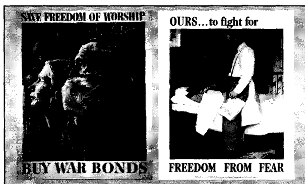
Figura 9.- Salvar la libertad de culto 60

tico para la superación de tensiones coyunturales, gracias un reparto equilibrado del poder ( checks & balances ), que ha de servir para poner límites a la corrupción y sus abusos ( accountability ), además de garantizar una mejor gestión del bien común, el interés general y la justicia social (v.g. DIE, CEU). Y en su dimensión exterior, el federalismo deja traslucir su bagaje recibido de la tradición sacra (v.g. chosen people, as light/leader of nations ) y profana (v.g. ligas y foedi ), cuya fusión da lugar al ADM. En tal sentido, ha habido diversas doctrinas mesiánicas de federalismo estadounidense, v.g. doctrina Monroe, el corolario Roosevelt . Fue el Presidente ROOSEVELT, quien recurriendo a la libertad religiosa, diseñó una geopolítica de aliados y enemigos, convenciendo a sus compatriotas para entrar en la II Guerra Mundial (vid. figura 9). Tal estrategia, casi medio siglo después fue usada por otro demócrata, el Presidente CLINTON, para articular el sistema IRFA (de libertad religiosa internacional ), con el que los EE.UU. pudiera justificar sus intervenciones exteriores. Sin embargo, debido a su escándalo sexual, y con la confirmación de los neoconservadores en la Adm. W.BUSH, tras los atentados terroristas del 11/S, la causa de la libertad religiosa, su geopolítica correspondiente y el federalismo mesiánico quedó seriamente comprometido, dando lugar a buena parte del problema actual relativo al recurso del factor religioso (vid. Conclusiones ).