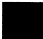
COLOR VERDE PANTONE PMS 361