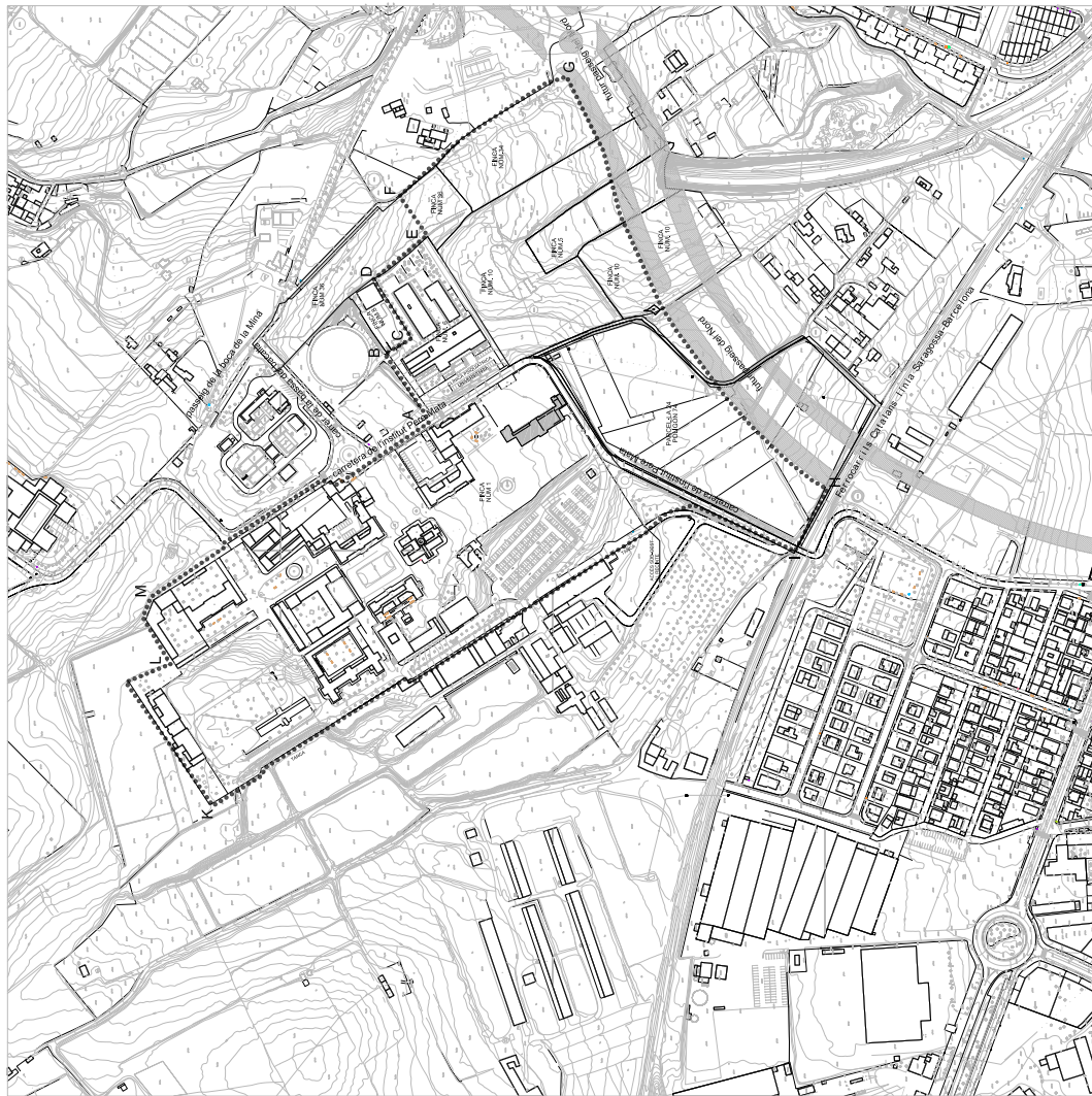
PAVEL·LÓ n.6 - INSTITUT PERE MATA

INICI Elaborat per: ign@ign.es Cadastral de Catalunya Projecte: 02/00000000