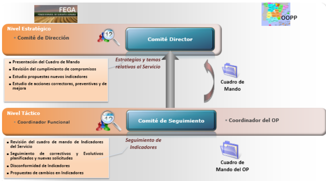
Ilustración 3. Modelo de control y seguimiento de indicadores

Comité Director periódico de control y seguimiento. Periódicamente, el FEGA internamente revisará la adecuación de los indicadores de nivel de servicio a las necesidades del OP y al volumen de actividad real, estudiando la progresión de los mismos en el tiempo. Esta revisión puede acarrear diversas acciones correctivas, tales como: reorganización de equipos, mejoras de procesos operativos de soporte, recursos humanos y modificaciones en niveles de servicio y/o en la valoración de los servicios. En estas reuniones se comprobarán las desviaciones respecto a los niveles de servicio establecidos: