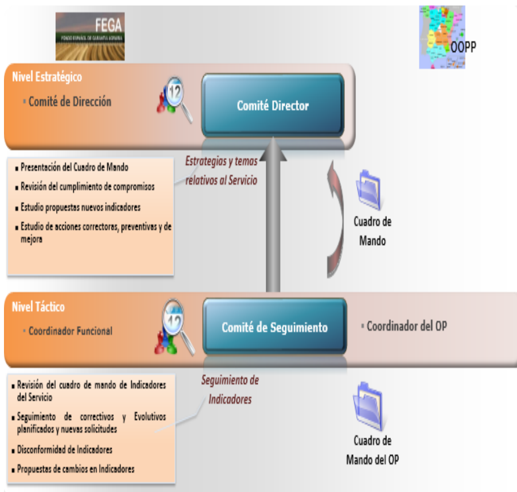
Ilustración 3. Modelo de control y seguimiento de indicadores.

– Comité Director periódico de control y seguimiento. Periódicamente, el FEGA internamente revisará la adecuación de los indicadores de nivel de servicio a las necesidades del OP y al volumen de actividad real, estudiando la progresión de los mismos en el tiempo. Esta revisión puede acarrear diversas acciones correctivas, tales como: reorganización de equipos, mejoras de procesos operativos de soporte, recursos humanos y modificaciones en niveles de servicio y/o en la valoración de los servicios. En estas reuniones se comprobarán las desviaciones respecto a los niveles de servicio establecidos.