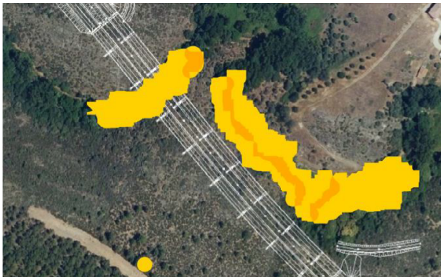
Imagen 3. Viaducto sobre el río de la Ribera de Arriba con la vegetación de ribera cartografiada.

En cuanto a los viaductos sobre el río de la Ribera de Arriba y el río Cuevas del Peral, el documento presentado por el promotor, basándose en la configuración de la ZEC y en la vegetación de ribera cartografiada para este trabajo, incluye las siguientes imágenes para justificar que las pilas no afectan a la vegetación de ribera: