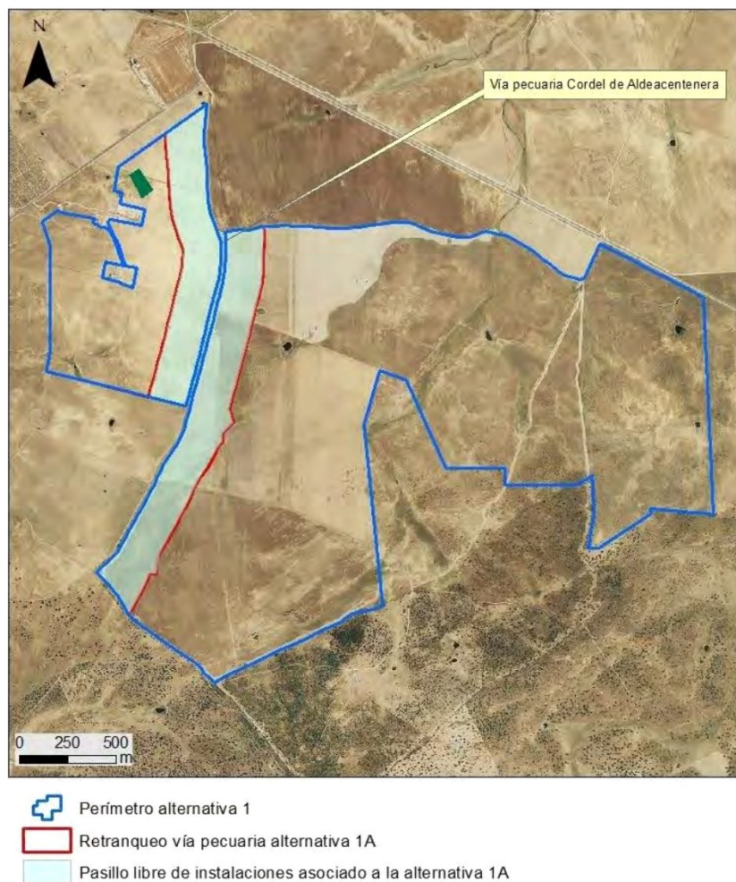
Figura 2 . Alternativa 1A.

Pizarro», «Ictio Orión» y «Campo de Arañuelo». El establecimiento de este corredor fue el origen de la optimización de la alternativa 1, retranqueando las instalaciones a una distancia de 200 m a ambos lados del eje de la vía pecuaria «Cordel de Aldeacentenera», formando un pasillo de 400 m de ancho libre de paneles y conformando de este modo la denominada alternativa 1A que fue la alternativa elegida en el EsIA que se sometió a información pública y consultas.